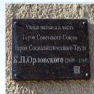
Открытие информационной доски К.П.Орловскому – Герою Советского Союза, Герою Социалистического Труда