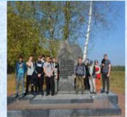
Походы по местам партизанской славы