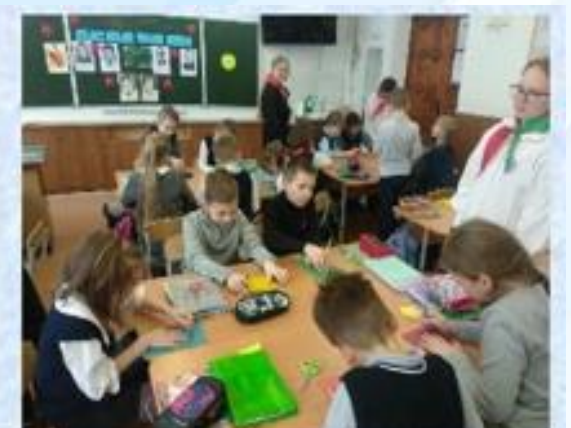
Урок Памяти «Маленькие герои большой войны»