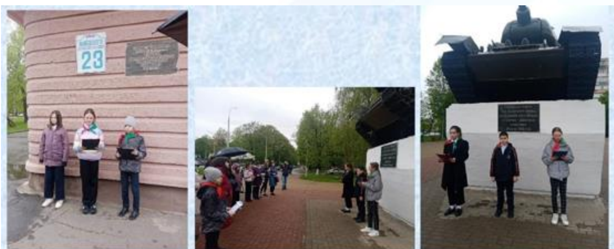
Экскурсия по микрорайону школы «Милый сердцу мой микрорайон...»