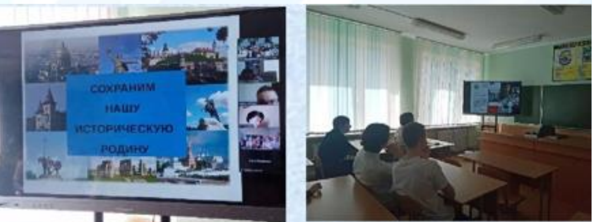
Российско-Белорусской конференция памяти дважды Героя Советского Союза П. И. Батова в рамках Международной эстафеты памяти и благодарности «Родина подвига – Родине Героя»