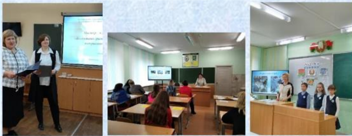
День инноваций (в рамках VII Методического фестиваля «Инновации в образовании Могилевской области в интересах реализации стратегии устойчивого развития»)