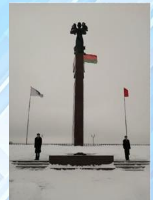
Вахта Памяти на Почётном Посту Памяти павших за Отечество на площади Славы